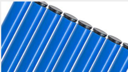
TUBO PLASTIFICADO - 4MTS TC