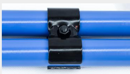
UNIÓN COMPUESTA UC-7