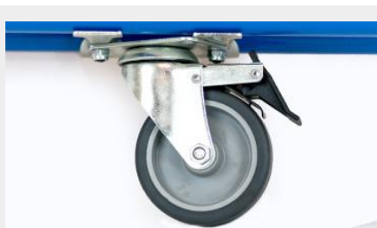
RUEDA DE POLIURETANO DE 4" GIRATORIA CON FRENO RP4" G C/F