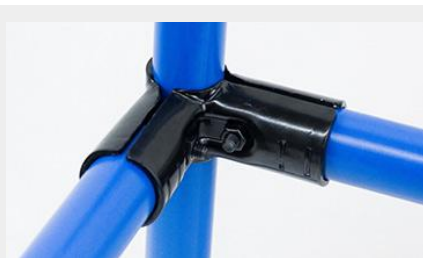
UNIÓN COMPUESTA UC-2