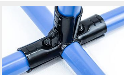
UNIÓN COMPUESTA UC-4