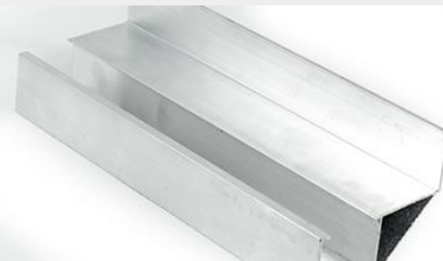
GUÍA LATERAL DE ALUMINIO GLA