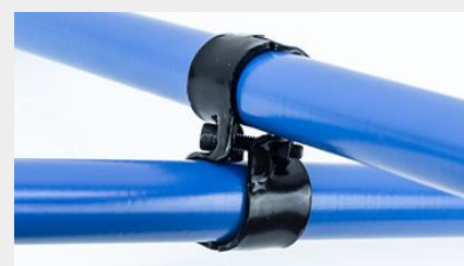
UNIÓN COMPUESTA UC-9