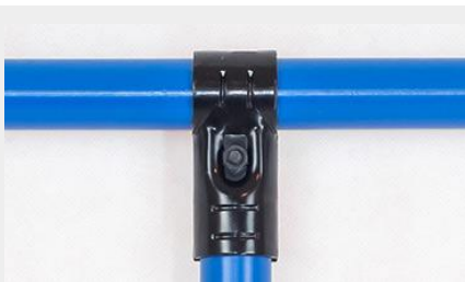
UNIÓN COMPUESTA UC-1