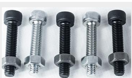
TORNILLO Y TUERCA 6MM SOCKET 6x30 TYT