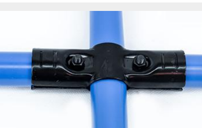
UNIÓN COMPUESTA UC-3