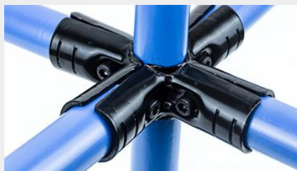
UNIÓN COMPUESTA UC-5