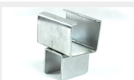
UNIÓN RIEL UR