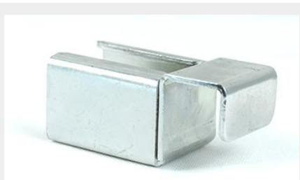
SOPORTE TRASERO SIN TOPE PARA RIEL ST