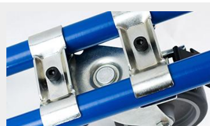
SUJETADOR DE RUEDA SR