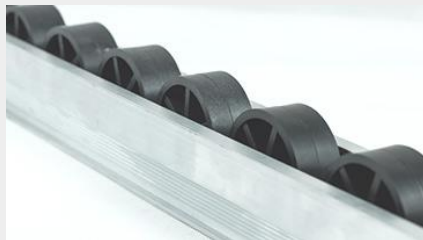
RIEL DE ALUMINIO CON RUEDAS INTERNAS - 4MTS DE LARGO - RC