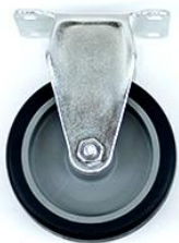
RUEDA DE POLIURETANO DE 4\"/> CON PLACA FIJA RP4\" F