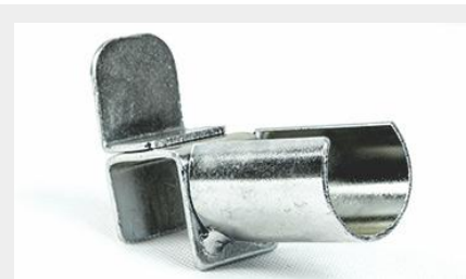
SOPORTE DELANTERO CON TOPE PARA TUBO SDT