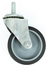
RUEDA DE POLIURETANO DE 4\"/> DE VÁSTAGO SIN FRENO RV4\" S/F