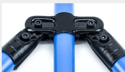
UNIÓN COMPUESTA UC-8