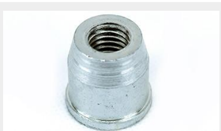
COPELE DE TUBO PARA RUEDA ½ CT