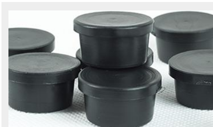
TAPÓN PLÁSTICO PARA FIN DE TUBO TAP