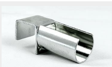
SOPORTE TRASERO SIN TOPE PARA TUBO STT