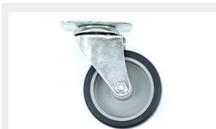
RUEDA DE POLIURETANO DE 4" GIRATORIA SIN FRENO RP4" G S/F