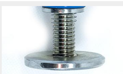
BASE AJUSTABLE DE PISO INCLUYE COPLE BAP