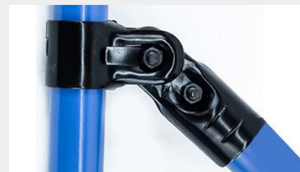
UNIÓN COMPUESTA UC-6