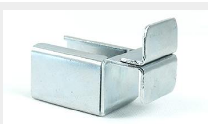
SOPORTE DELANTERO CON TOPE PARA RIEL SD