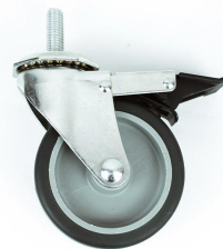
RUEDA DE POLIURETANO DE 4\"/> DE VÁSTAGO CON FRENO RV4\" C/F